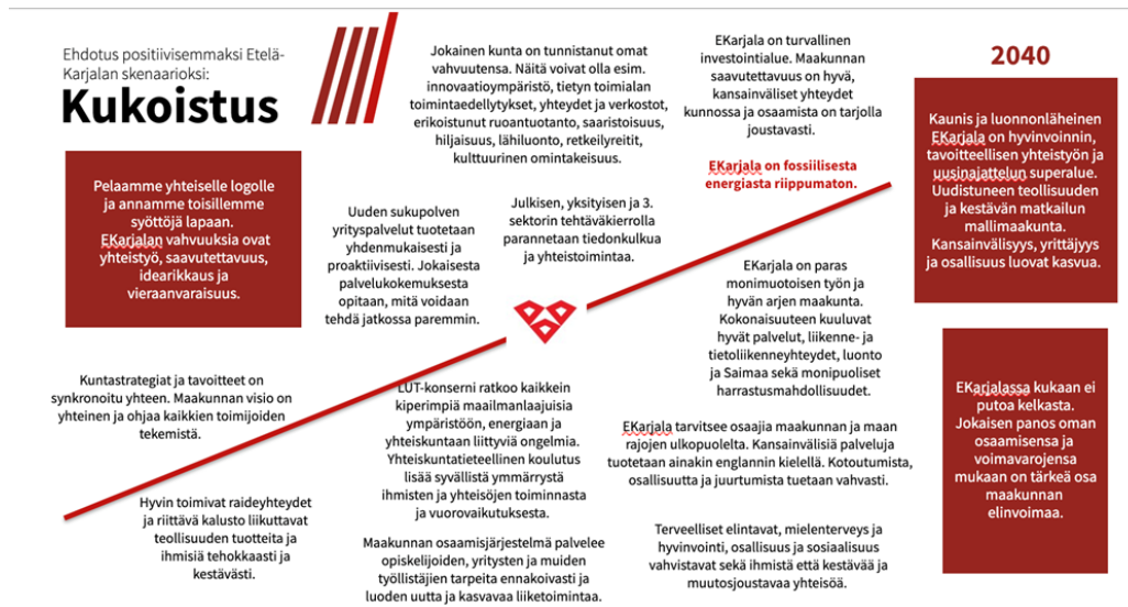
Kuva 2. Etelä-Karjalan Kukoistus - skenaario

Maakunnasta tehdään maakuntaohjelmaa sekä positiivista skenaariota toteuttamalla houkuttelevampi paikka yrityksille ja ihmisille. Asukkaille tarjotaan parempia työllisyys- ja koulutusmahdollisuuksia sekä yhteisöllisyyttä luovia aktiviteetteja, jotka edistävät ihmisten hyvinvointia ja terveyttä, lisäävät toimeentuloa sekä ehkäisevät syrjäytymistä. Yritysten ja oppilaitosten välistä yhteistyötä tiivistetään, jotta siirtymä työelämään olisi mahdollisimman sujuva ja yritykset saisivat osaavaa työvoimaa rekrytointitarpeisiinsa. Koulutusmahdollisuudet nähdään merkittävänä vetovoimatekijänä sekä opiskelijoille että yrityksille. Yrittäjyyteen lähtemistä tuetaan ja siihen kannustetaan monipuolisesti. Näin edistetään positiivista ilmapiiriä yrittäjyyden ympärille sekä lisätään maakunnan veto- ja pitovoimaa.