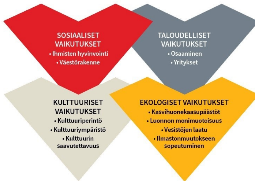
Kuva 2. Vaikutusten arvioinnin näkökulmat.

Seuraavassa käsitellään tarkemmin vaikutusten arvioinnin näkökulmat eli avataan arviointikehikon sisältö.