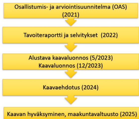
Kuva Etelä-Karjalan maakuntakaava 2040:n aikataulusta

Vuonna 2022 maakuntakaava 2040:n suunnittelutyötä varten on kaavalle hyväksytty tavoitteet (tavoiteraportti), nimetty ohjausryhmä ja tunnistettu keskeiset sidosryhmät. Suunnittelutehtävät ovat edenneet tavoiteaikataulun mukaisesti. Vuonna 2022 on valmistunut seuraavat selvitykset maakuntakaavan laadintaa varten: Etelä-Karjalan siniviherrakenne ja ekosysteemipalvelut -selvitys, ensimmäisen maailmansodan aikaiset maalinnoitteet Etelä-Karjalassa-selvitys ja Etelä-Karjalan tuulivoimaselvitys. Tuulivoimaselvityksessä tunnistettiin maakunnan alueelta 23 potentiaalista aluetta, joista vain yksi voitaisiin toteuttaa Puolustusvoimien lausunnon mukaan Luumäen Suurikankaalle. Vuonna 2022 selvitystyöt aloitettiin liittyen ampumaratojen kehittämissuunnitelmaan, paikkatietotarkasteluihin, kaupan selvityksen päivittämiseen ja modernin rakennuskannan inventointiin. Kuntien kaavoittajien kanssa käytiin kuntakerros, jossa käsiteltiin kuntien näkemyksiä voimassa olevasta maakuntakaavasta. Alustavan kaavaluonnoksen suunnittelukaataulu on hieman viivästynyt johtuen vaihemaakuntakaavan valitusasiasta. Joulukuussa 2021 maakuntavaltuustossa hyväksytystä Lappeenrannan 2. vaihemaakuntakaavasta jätettiin viisi valitusta, jotka Itä-Suomen hallinto-oikeus hylkäsi 14.12.2022. Hallinto-oikeuden ratkaisusta on jätetty kaksi valituslupahakemusta korkeimpaan hallinto-oikeuteen.