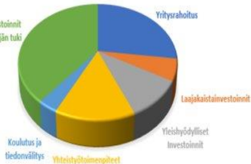
KAAKKOIS-SUOMEN ELY-KESKUKSEN RAHOITUSKEHYKSEN JAKAUMA