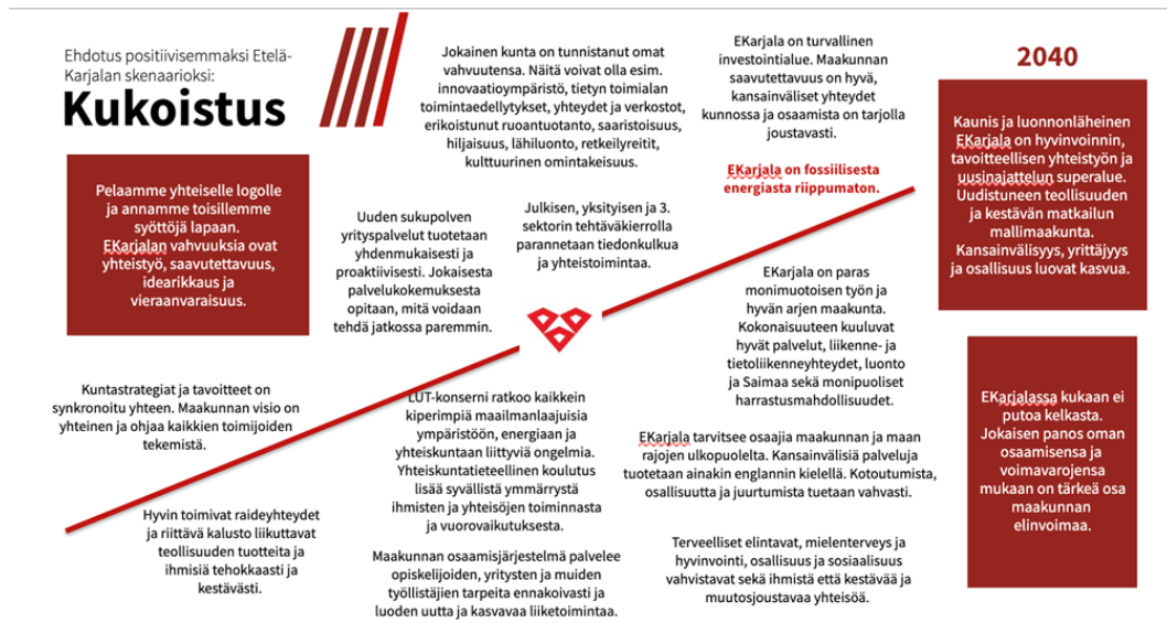
Kuva 2. Etelä-Karjalan Kukoistus - skenaario

Maakunnasta tehdään maakuntaohjelmaa sekä positiivista skenaariota toteuttamalla houkuttelevampi paikka yrityksille ja ihmisille. Asukkaille tarjotaan parempia työllisyys- ja koulutusmahdollisuuksia sekä yhteisöllisyyttä luovia aktiviteetteja, jotka edistävät ihmisten hyvinvointia ja terveyttä, lisäävät toimeentuloa sekä ehkäisevät syrjäytymistä. Yritysten ja oppilaitosten välistä yhteistyötä tiivistetään, jotta siirtymä työelämään olisi mahdollisimman sujuva ja yritykset saisivat osaavaa työvoimaa rekryointitarpeisiinsa. Koulutusmahdollisuudet nähdään merkittävänä vetovoimatekijänä sekä opiskelijoille että yrityksille. Yrittäjyyteen lähtemistä tuetaan ja siihen kannustetaan monipuolisesti. Näin edistetään positiivista ilmapiiriä yrittäjyyden ympärille sekä lisätään maakunnan veto- ja pitovoimaa.