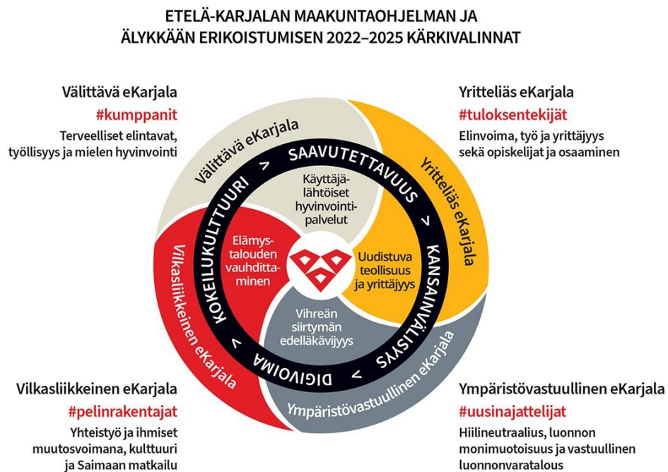
Kuva 1. Maakuntaohjelman kärkivalinnat

Tärkein koko maakunnan suuntaa viitoittava asiakirja on maakuntaohjelma, jonka maakuntaliitto laatii maakunnan kehittämisen tavoitteet sekä keskeiset toimet sisältäen neljäksi vuodeksi kerrallaan. Tuoreessa vuoteen 2025 tähtäävän maakuntaohjelman neljä kehittämisen kärkeä ovat: Välittävä eKarjala, Yritteliäs eKarjala, Ympäristövastuullinen eKarjala ja Vilkasliikkeinen eKarjala. Lisäksi maakuntaohjelma sisältää alue- ja rakennepolitiikan rahoitusta ohjaavan älykkään erikoistumisen strategian.