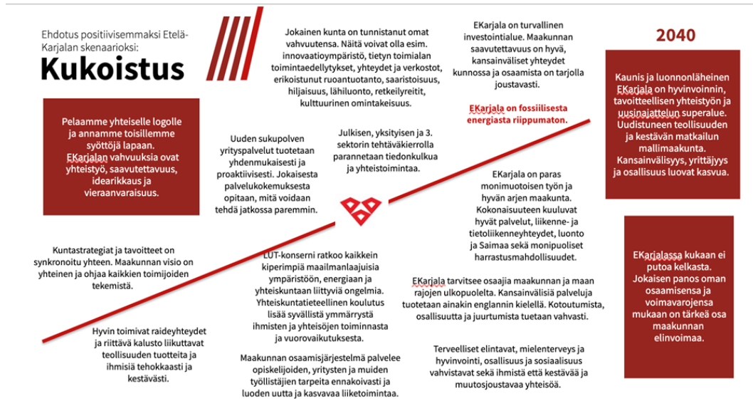
Kuva 2. Etelä-Karjalan Kukoistus - skenaario

Maakunnasta tehdään maakuntaohjelmaa sekä positiivista skenaariota toteuttamalla houkuttelevampi paikka yrityksille ja ihmisille. Asukkaille tarjotaan parempia työllisyys- ja koulutusmahdollisuuksia sekä yhteisöllisyyttä luovia aktiviteetteja, jotka edistävät ihmisten hyvinvointia ja terveyttä, lisäävät toimeentuloa sekä ehkäisevät syrjäytymistä. Yritysten ja oppilaitosten välistä yhteistyötä tiivistetään, jotta siirtymä työelämään olisi mahdollisimman sujuva ja yritykset saisivat osaavaa työvoimaa rekryointitarpeisiinsa. Koulutusmahdollisuudet nähdään merkittävänä vetovoimatekijänä sekä opiskelijoille että yrityksille. Yrittäjyyteen lähtemistä tuetaan ja siihen kannustetaan monipuolisesti. Näin edistetään positiivista ilmapiiriä yrittäjyyden ympärille sekä lisätään maakunnan veto- ja pitovoimaa.