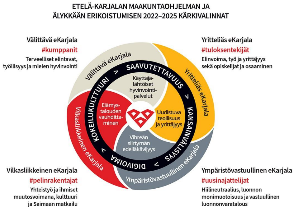
Kuva 1. Maakuntaohjelman kärkivalinnat

Tärkein koko maakunnan suuntaa viitoittava asiakirja on maakuntaohjelma, jonka maakuntaliitto laatii maakunnan kehittämisen tavoitteet sekä keskeiset toimet sisältäen neljäksi vuodeksi kerrallaan. Tuoreessa vuoteen 2025 tähtäävän maakuntaohjelman neljä kehittämisen kärkeä ovat: Välittävä eKarjala, Yritteliäs eKarjala, Ympäristövastuullinen eKarjala ja Vilkasliikkeinen eKarjala. Lisäksi maakuntaohjelma sisältää alue- ja rakennepolitiikan rahoitusta ohjaavan älykkään erikoistumisen strategian.