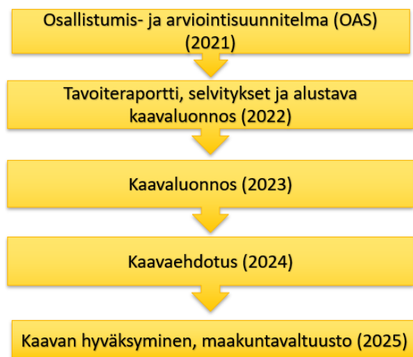
Kuva 4. Etelä-Karjalan maakuntakaava 2040:n aikataulu

Maakuntaaavatyön lisäksi Etelä-Karjalan liitto antaa lausuntoja kuntien kaavahankkeista. Liitto osallistuu myös kuntien ja Kaakkois-Suomen ELY-keskuksen välisiin kehittämiskeskusteluihin ja kuntien kaavahankkeiden viranomaisneuvotteluihin.